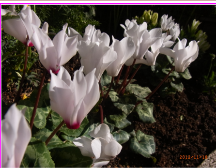
白：嫉妬、思いやり 【花言葉】赤：はにかみ

リスク・カウンセラーの仕事は、目の前に「マイナス要因」が見つかったときでも、それを「プラス要因」に転じることへの努力を惜しまないという発想で取り組むことを旨としています。リスク・カウンセラーだけでは為し得ない数々の問題は、それを支えて下さる多くの専門家がいればこそ…と感謝しつつ、多くの人々に希望を与えられるように、奮闘を続けているのです。