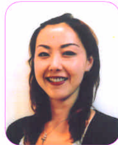
左がファンデーションをしている我流のメイク。素肌ポイントメイクにするだけで見違えるようになります。